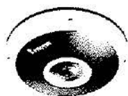
Caméra IP 5MP 360° / 180°